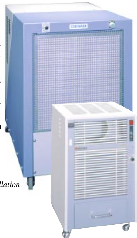
Modell T3500 för golvinstallation

Överallt där människan och värdefulla föremål måste skyddas mot för hög fuktighet kan Du använda SELEKOS Edenair, den suveräna problemlösaren. Avfuktaren är robust och kan placeras i källare, arkiv, magasin, simhallar, lagerhallar, skyddsrum, laboratorier, klädtorkrum och växthus mm. En optimalt dimensionerad hetgasslinga gör det möjligt att använda avfuktaren med god kapacitet ner till temperaturer nära 0°C. Den önskade relativa fuktigheten regleras enkelt via den i aggregatet inbyggda hygrostaten